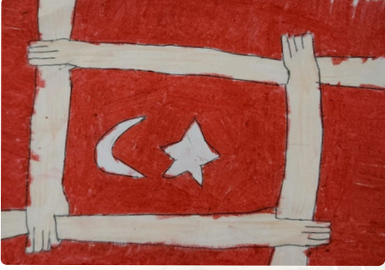
Ayşe Esra SANCAR/ 5-A