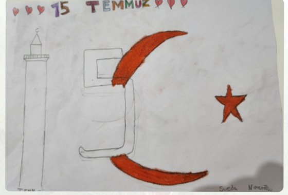
-Sueda NİMETOĞLU/ 5-A