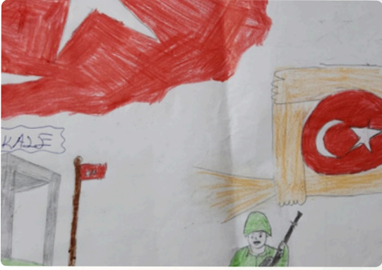
Beritan BAYTİMUR/ 5-A