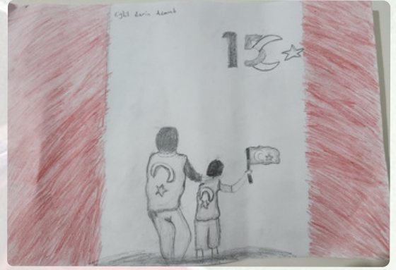
Eylül Ecrin AZAMLI/ 5-B