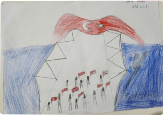
Serra HASHAN/ 5-A