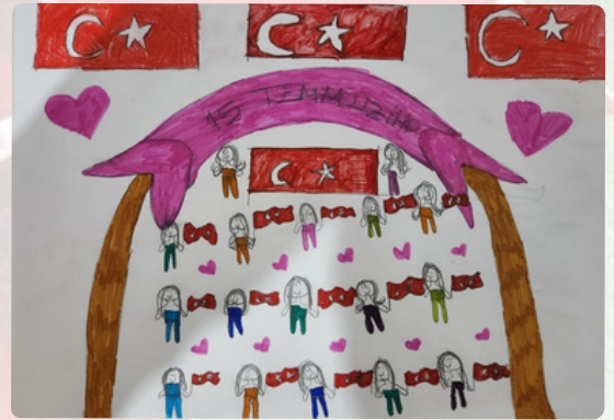
Nehir İÇİN/ 5-A